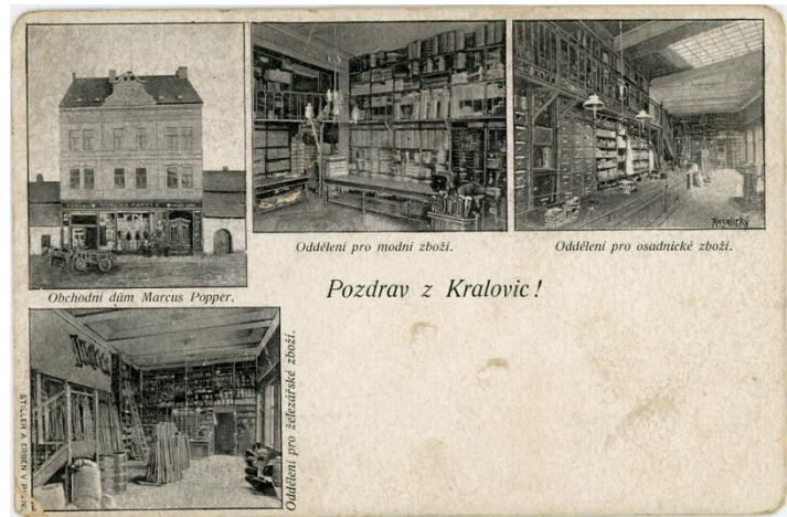
Pohlednice (fotky z obchodu Marcus Popper)