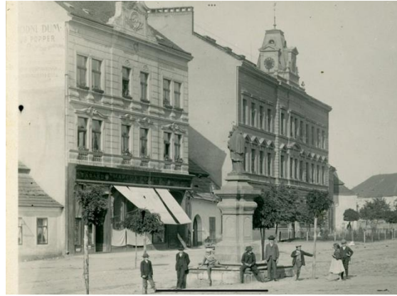
Dům s čp. 30, který patřil Popperovým i s obchodem